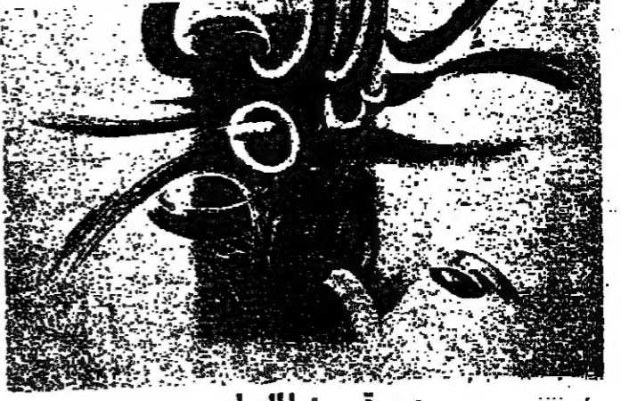
صورة من الماوارء